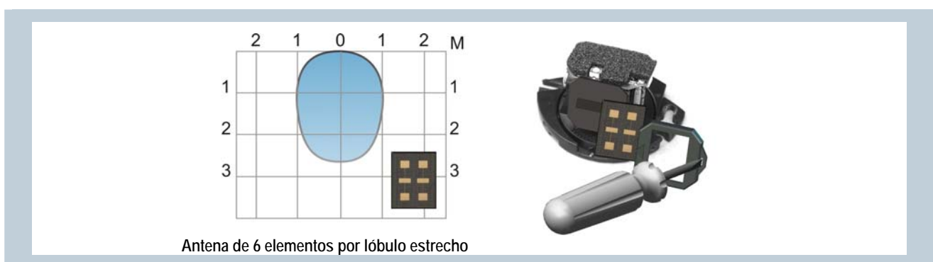
Antena de 6 elementos por lóbulo estrecho